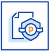
안전성 확보 조치